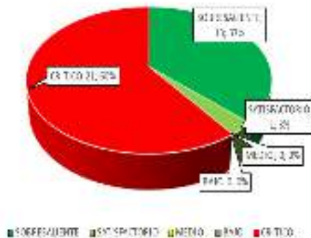
Gráfica 2: Comportamiento eje III – Fomento de la Productividad para la Competitividad y el Crecimiento Económico.

El tercer y último eje, está compuesto por 35 indicadores, de los cuales 13 se encuentran en estado sobresaliente, que representan un 37,1%, donde todos pertenecen a 3 actores internos.