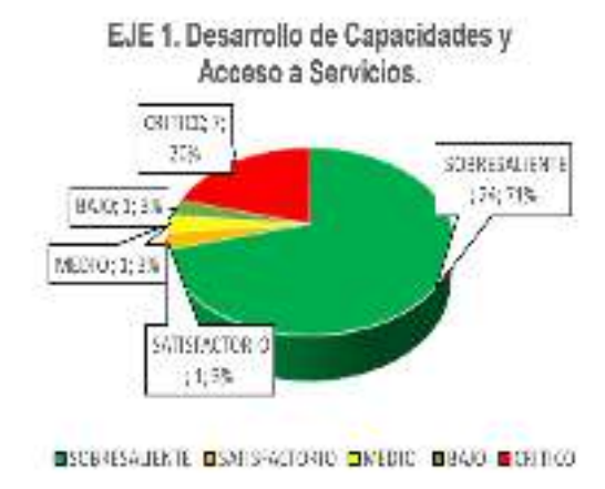
Gráfica 2: Comportamiento Eje 1 – Desarrollo de Capacidades y Acceso a Servicios

De los 34 indicadores que comprende el eje 1, 24 de ellos se encuentran en estado sobresaliente, representando el 70,5%.