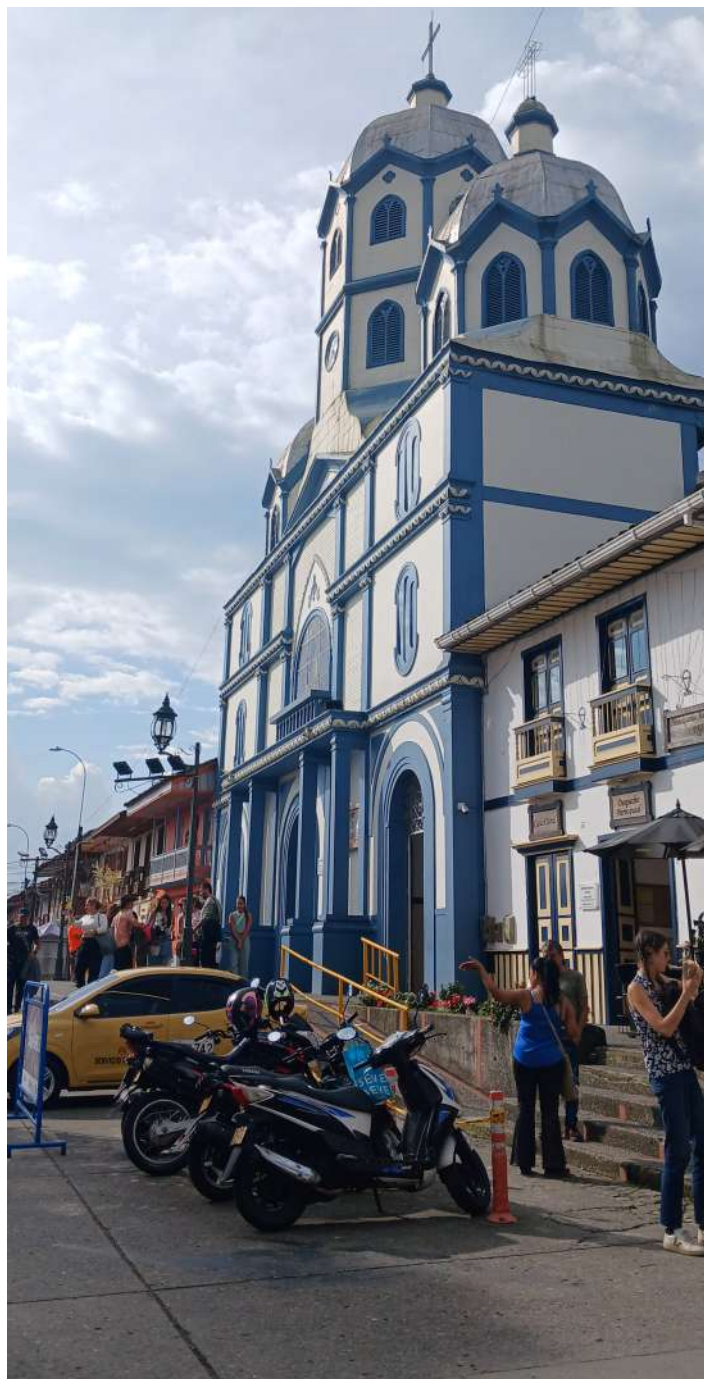
Patrimonio religioso en Filandia

En un territorio tan rico en diversidad como la conservación del Paisaje Cafetero, declarado Patrimonio de la Humanidad, es vital para garantizar que las futuras generaciones puedan disfrutar de este legado. Los vigías son guardianes comprometidos con la educación, la conciencia ambiental y la promoción del patrimonio, asegurando su permanencia y respeto a lo largo del tiempo y a esto le viene apuntando el Gobierno Departamental a través de la Secretaría de Cultura.