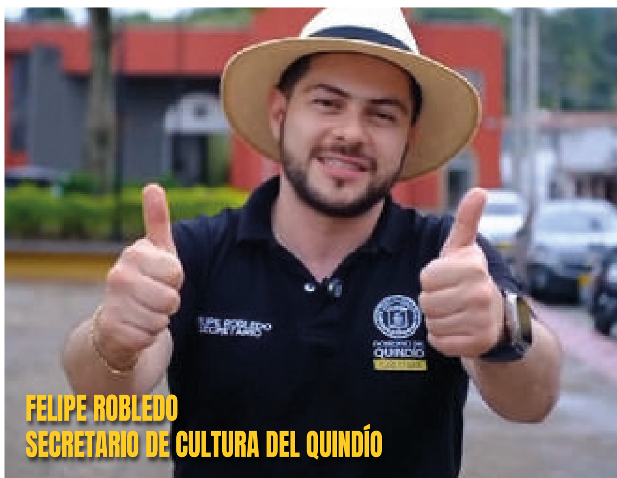
FELIPE ROBLEDO SECRETARIO DE CULTURA DEL QUINDÍO