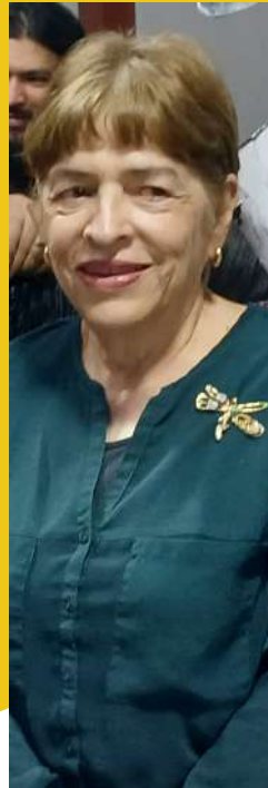
OLGA LUCIA JORDAN Fotógrafa