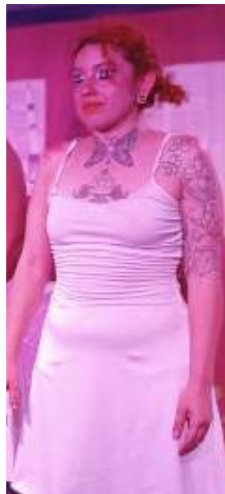
LA PUESTA EN ESCENA DE OJOS DE PERRO AZUL