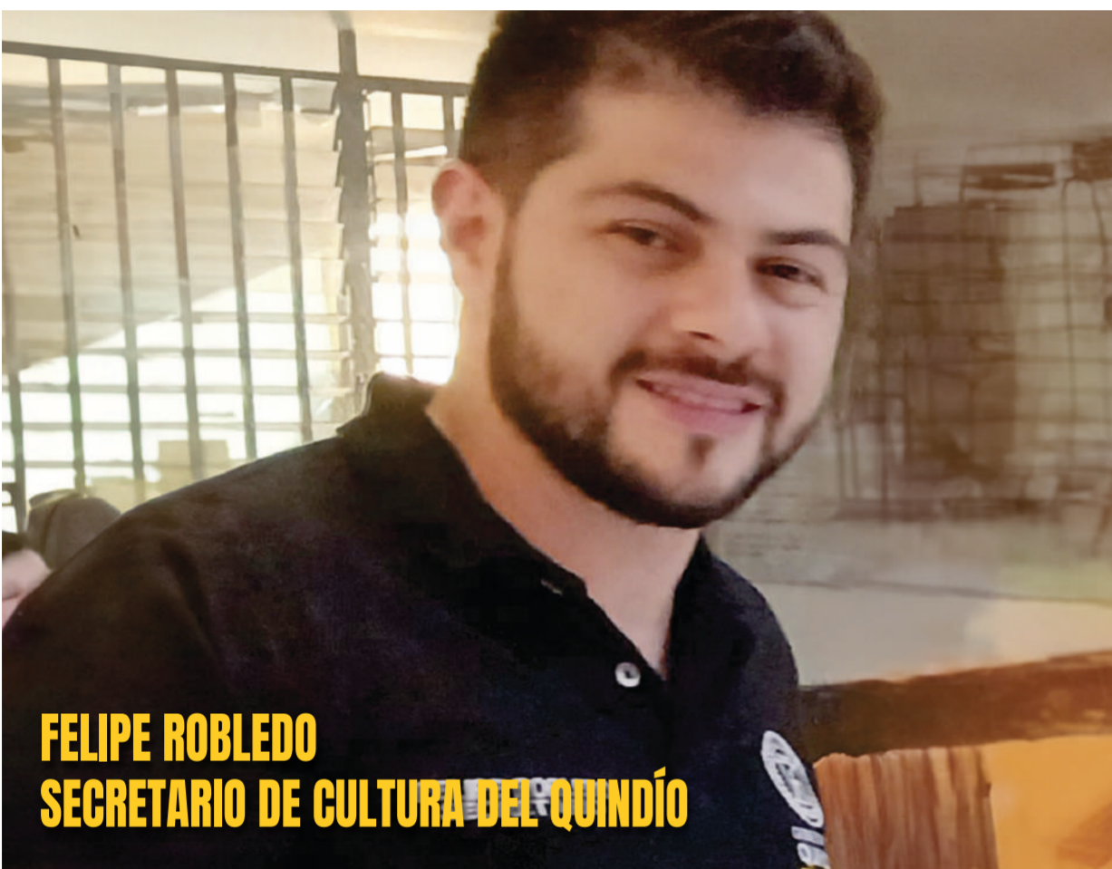
FELIPE ROBLEDO SECRETARIO DE CULTURA DEL QUINDÍO