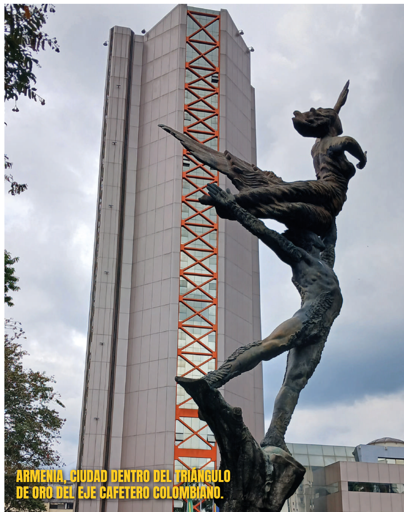
ARMENIA, CIUDAD DENTRO DEL TRIÁNGULO DE ORO DEL EJE CAFETERO COLOMBIANO.

de incremento en lo económico, en diferentes rubros que no son significativos, obviamente si nos comparamos con Risaralda y Caldas, ellos tienen su propia dinámica. Hoy entender la RAP Eje Cafetero implica entender que también estamos conectados muy cerca con Ibagué, con más de 45 Municipios que tiene el Departamento del Tolima y también desde luego, muy cercano con el Valle de Cauca, Risaralda y Caldas, esto nos permite ser un punto equidistante para muchos proyectos que se emprendan desde la RAP"