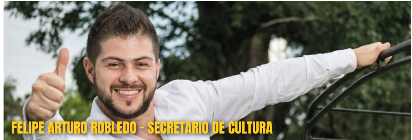
FELIPE ARTURO ROBLEDO - SECRETARIO DE CULTURA

"Hoy ver todos estos actos culturales, para mí es una forma de poder crear espacios diferentes para la gente, para las nuevas generaciones. Creo que esta jornada nos compromete a inyectarle un poco más de recursos al sector, porque esta es la única forma que tenemos para procurar mejores condiciones a nuestros jóvenes y oportunidades. Queremos una cultura donde mostremos todo aquello que nos identifica. Considero que es muy importante que en los tres años y medio que tenemos de gobierno, podamos nosotros, sacar adelante la cultura de nuestro Departamento"