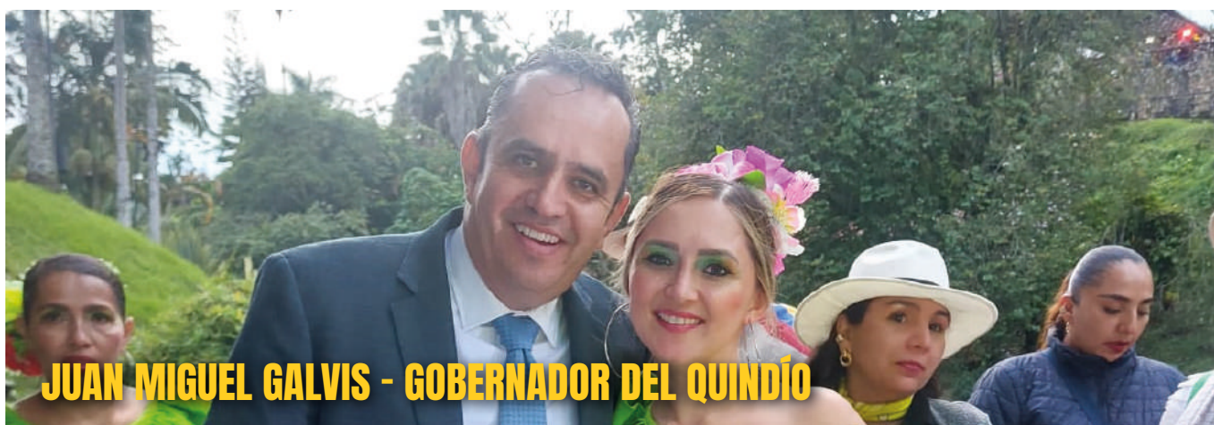
JUAN MIGUEL GALVIS - GOBERNADOR DEL QUINDÍO

"Hoy ver todos estos actos culturales, para mí es una forma de poder crear espacios diferentes para la gente, para las nuevas generaciones. Creo que esta jornada nos compromete a inyectarle un poco más de recursos al sector, porque esta es la única forma que tenemos para procurar mejores condiciones a nuestros jóvenes y oportunidades. Queremos una cultura donde mostremos todo aquello que nos identifica. Considero que es muy importante que en los tres años y medio que tenemos de gobierno, podamos nosotros, sacar adelante la cultura de nuestro Departamento"