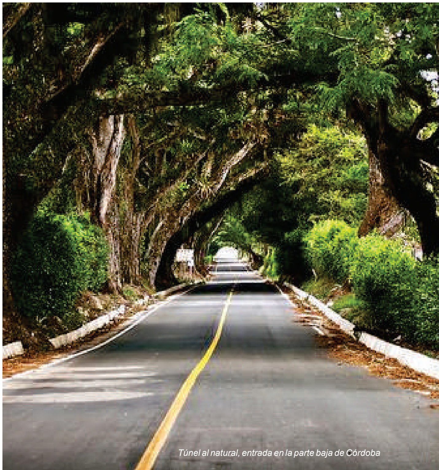
Túnel al natural, entrada en la parte baja de Córdoba