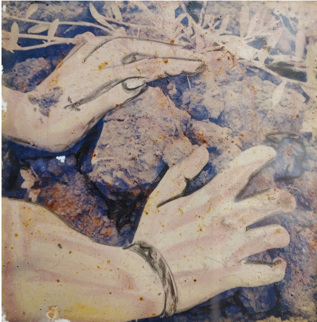
Obra expuesta en los Mogadores Asamblea Departamental