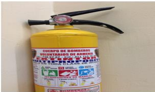
Instalación y revisión extintores