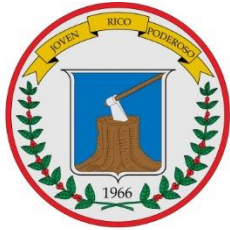
Departamento del Quindío