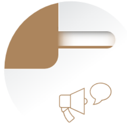
Espacios o Mecanismos de diálogo