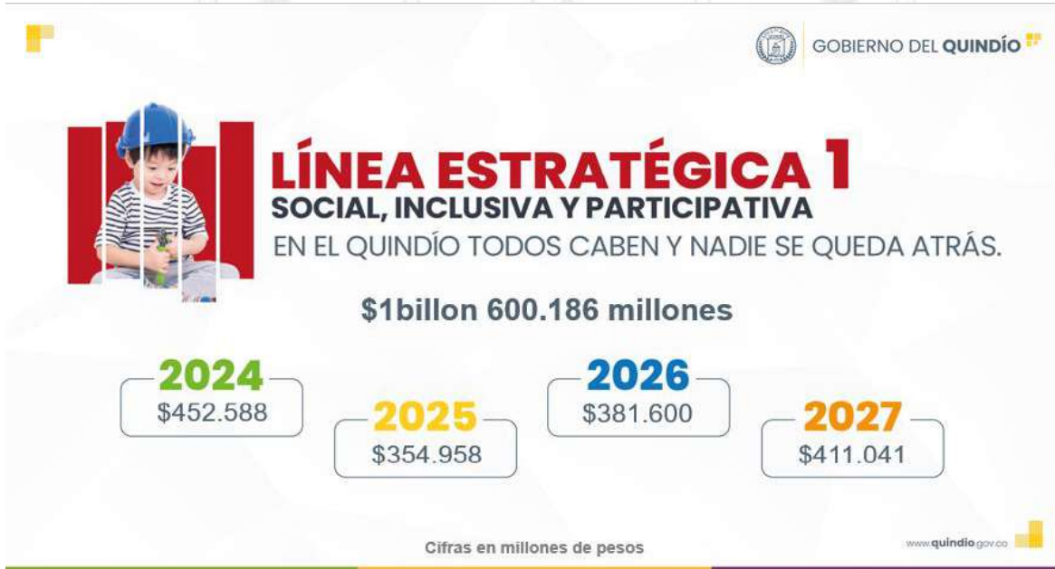
Gráfica No. 1 Distribución de Recursos Plan Plurianual de Inversiones Plan de Desarrollo 2024-2027 LÍNEA ESTRATÉGICA SOCIAL, INCLUSIVA Y PARTICIPATIVA “En el Quindío todos caben y nadie se queda atrás”

Fuente: Secretaría de Planeación departamental