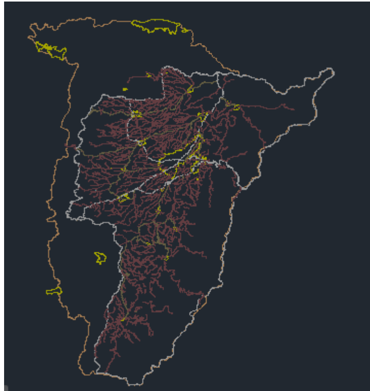
Vías Primarias que cruzan el Departamento del Quindío.

Sobre este plano de la red vial principal primaria se deben de aplicar los criterios de retiros viales y paramentos según lo expresado en el la ley 1128 del 2008; y tener un cuadro de áreas y afectaciones dentro del plano para crear restricciones y afectar los predios que están alrededor de estas vías.