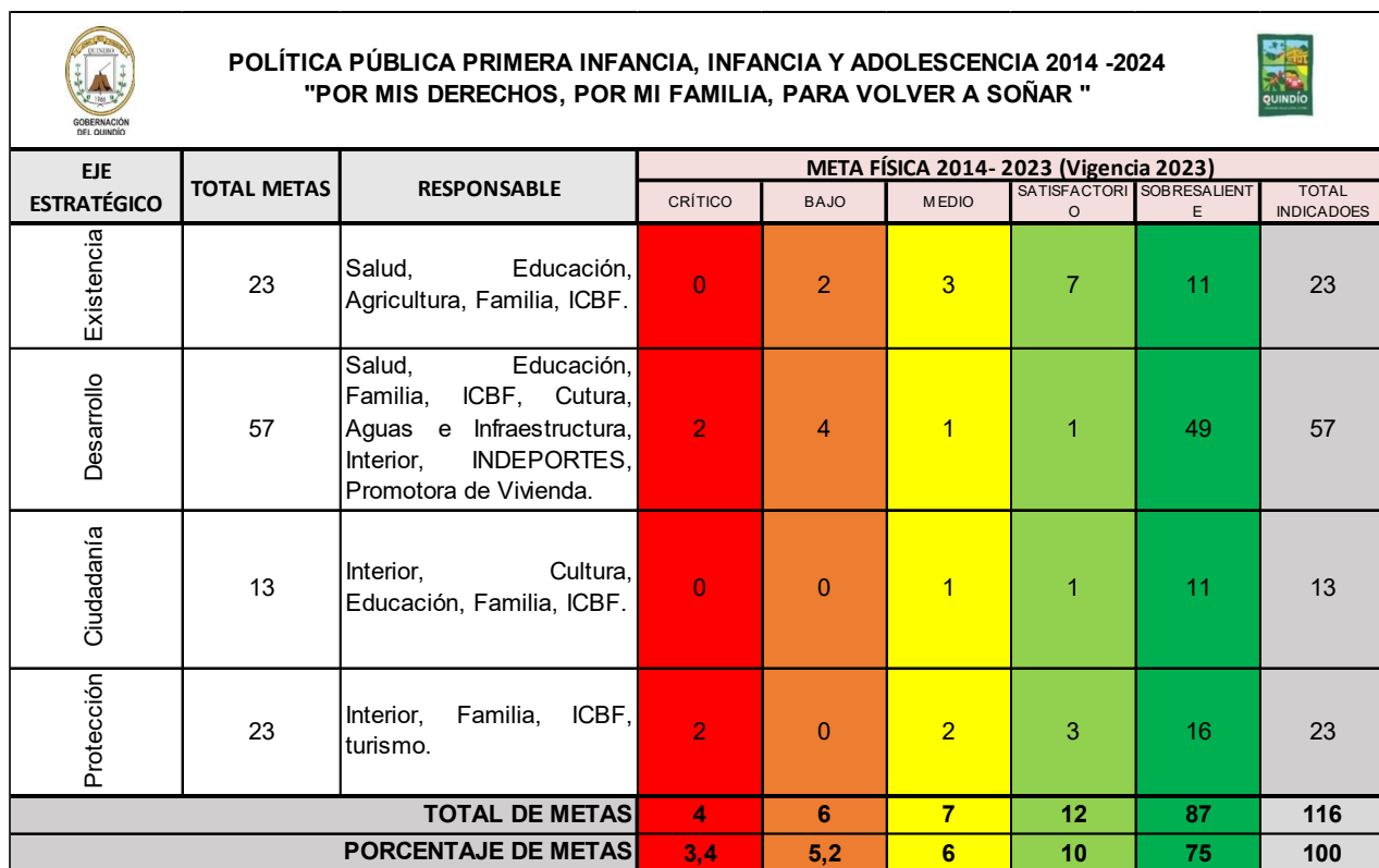
Tabla 1: SemafORIZACIÓN ejes estratégicos Política Pública de Primera Infancia, Infancia y Adolescencia 2014 – 2024 "Por mis derechos, por mi familia, para volver a soñar".

La anterior tabla, muestra el comportamiento general con corte al segundo trimestre de la vigencia 2023, desde el inicio de la Política, de acuerdo con el reporte de los actores estratégicos de la Política Pública.