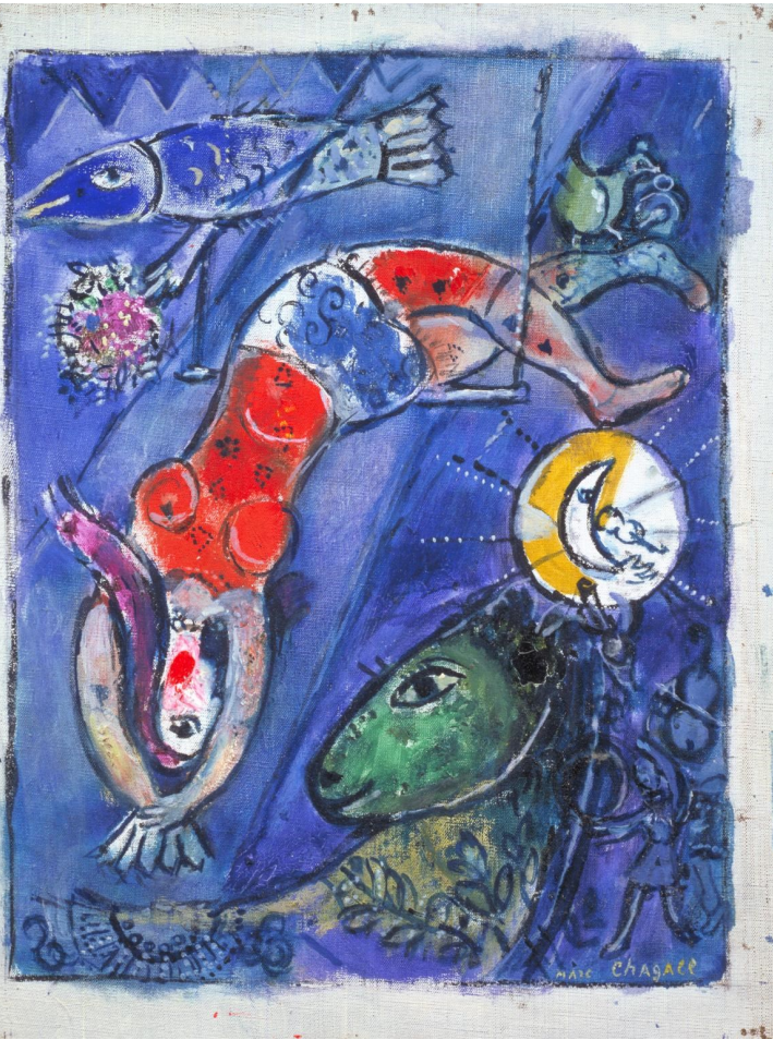
Marc Chagall, 'The Blue Circus' 1950