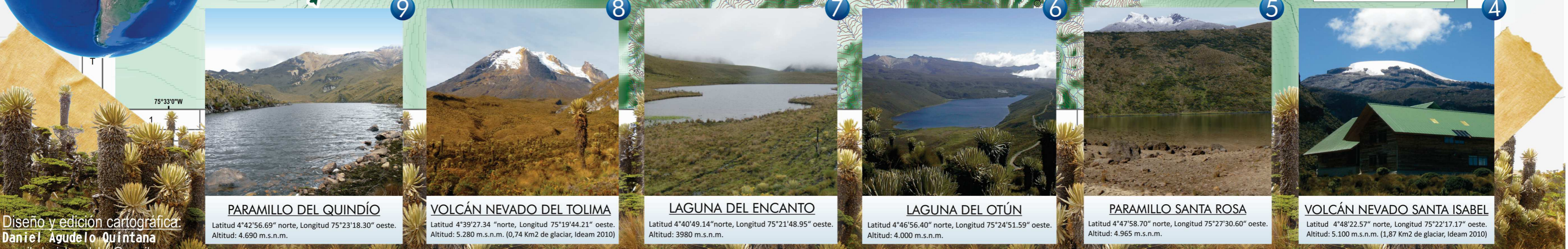
PARAMILLO DEL QUINDÍO Latitud 4°42'56.69" norte, Longitud 75°23'18.30" oeste. Altitud: 4.690 m.s.n.m. YOLCÁN NEVADO DEL TOLIMA Latitud 4°39'27.34" norte, Longitud 75°19'44.21" oeste. Altitud: 5.280 m.s.n.m. (0,74 Km2 de glaciar, ideam 2010) LAGUNA DEL ENCANTO Latitud 4°40'49.14" norte, Longitud 75°21'48.95" oeste. Altitud: 3.980 m.s.n.m. LAGUNA DEL OTÚN Latitud 4°46'56.40" norte, Longitud 75°24'51.59" oeste. Altitud: 4.000 m.s.n.m. PARAMILLO SANTA ROSA Latitud 4°47'58.70" norte, Longitud 75°27'30.60" oeste. Altitud: 4.965 m.s.n.m. YOLCÁN NEVADO SANTA ISABEL Latitud 4°48'22.57" norte, Longitud 75°22'17.17" oeste. Altitud: 5.100 m.s.n.m. (1,87 Km2 de glaciar, ideam 2010)